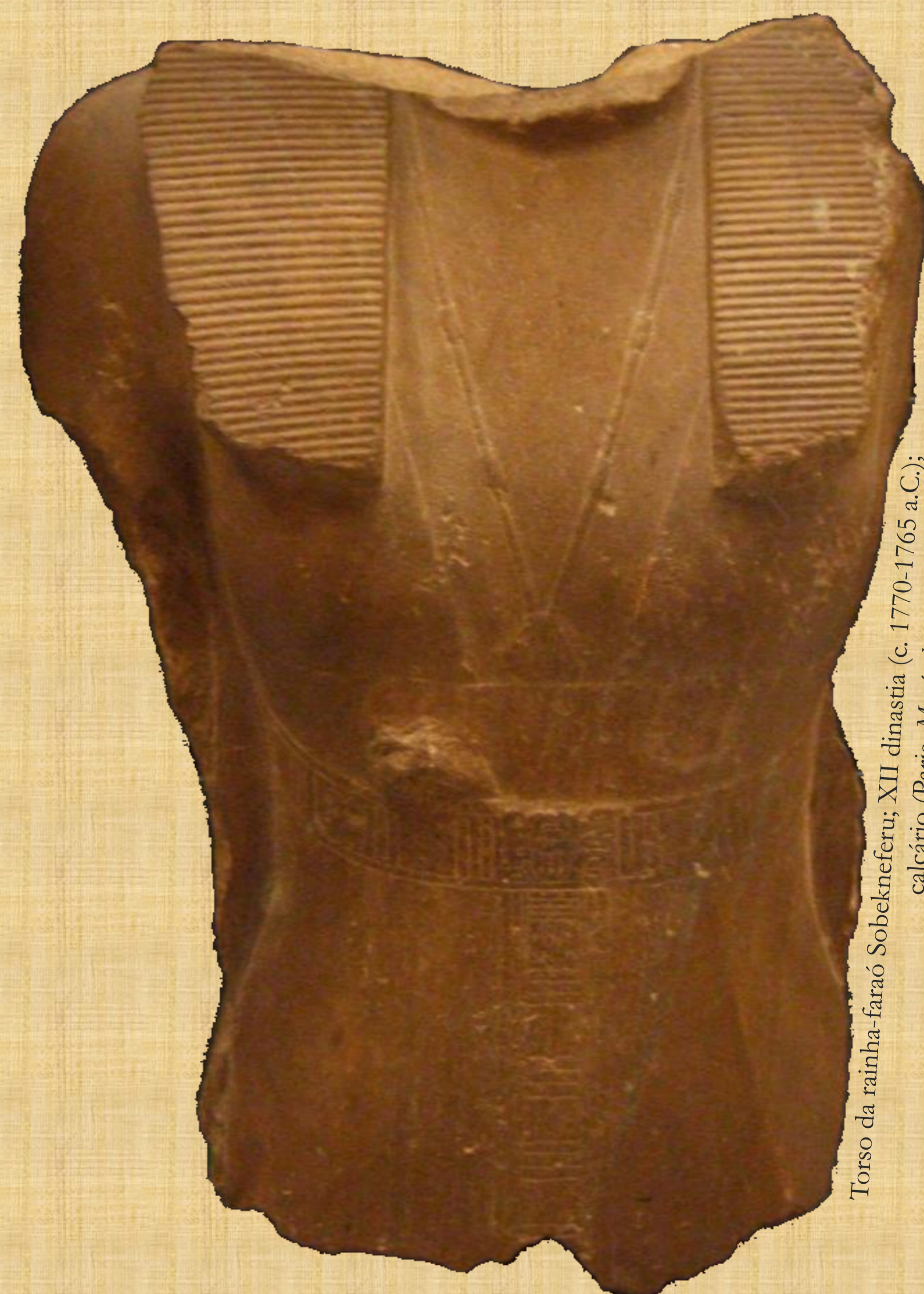
Torso da rainha-faráó Sobekneferu; XII dinastia (c. 1770-1765 a.C.); calcário (Paris, Musée du Louvre, 032007)