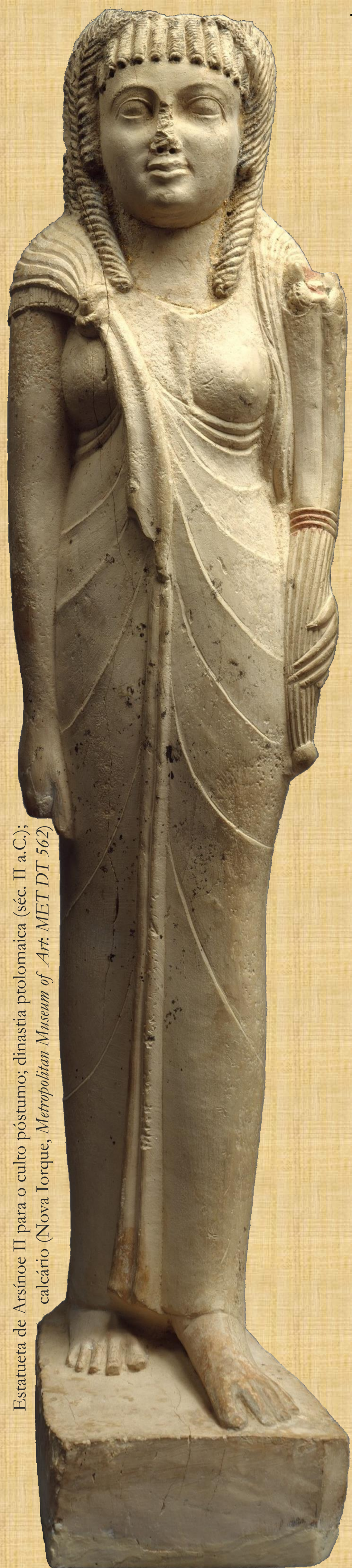
Estatueta de Arsínoe II para o culto pós-túmulo; dinastia ptolomaica (séc. II a.C.); calcário (Nova Iorque, Metropolitan Museum of Art, MET DT 562)